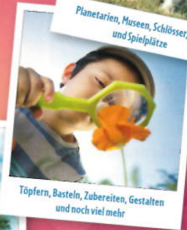
Töpfern, Basteln, Zubereiten, Gestalten und noch viel mehr