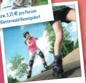
Flaeiming-Skate: 20 % sparen