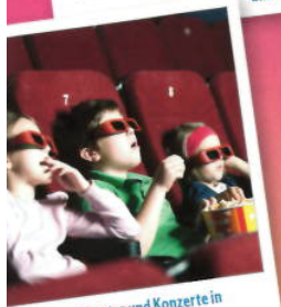
Kinos, Theater und Konzerte in ganz Brandenburg und Berlin