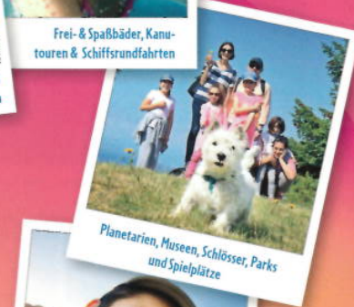
Planetarien, Museen, Schlösser, Parks und Spielplätze