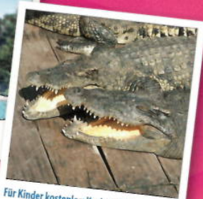
Für Kinder kostenlos: Krokodilstation Golzow