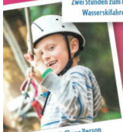
4,75 € bzw. 3,25 € pro Person sparen im Kletterwald Hennigsdorf