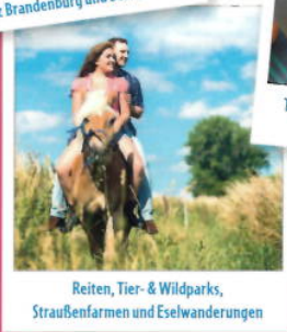
Reiten, Tier- & Wildparks, Straußenfarmen und Eselwanderungen