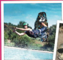
Zwei Stunden zum Preis von einer: Wasserskifahren in Velten