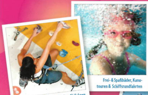
Klettern, Windsurfen, Eislaufen, Skifahren und Wandern

Der Familienpass gilt ein ganzes Schuljahr lang und bietet Rabattangebote von Perleberg bis Forst und von Elsterwerda bis Prenzlau: